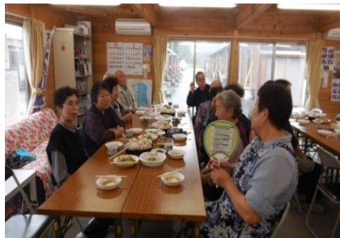
仮設住宅は高齢者が占める