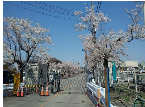
富岡町 解除・困難区域が道路で分けられる