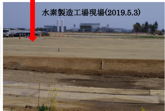
水素製造工場現場(2019.5.3)