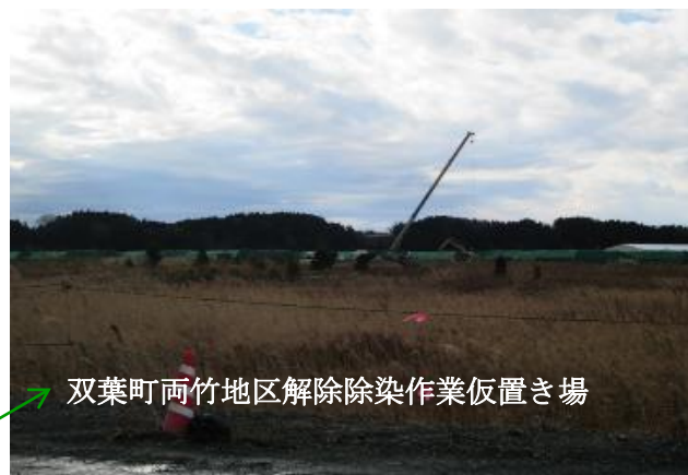
双葉町両竹地区解除除染作業仮置き場