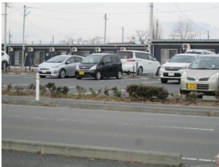
入居者あるも仮設住宅取り壊し進行中