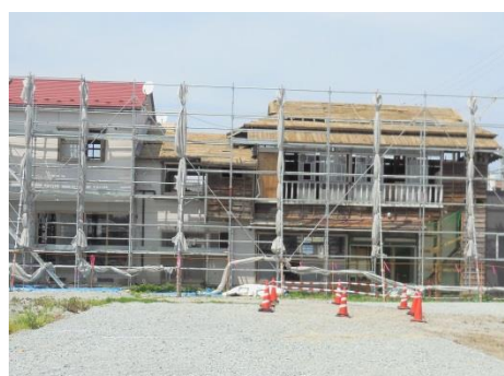
環境省管轄 民家解体現場