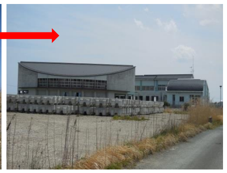
請戸小学校遺構に決定 (2019.5.3)