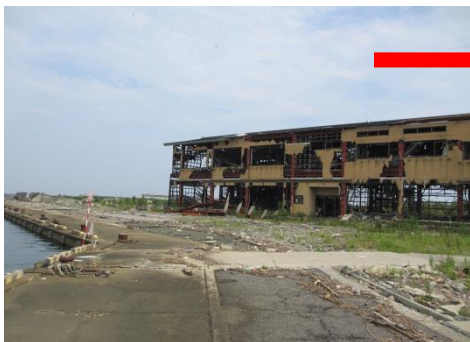
漁港 商業施設被害(2013.8.5)