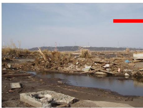
北萱浜地区集落全滅(2011.4.7)