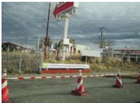
国道 6 号線 大熊町