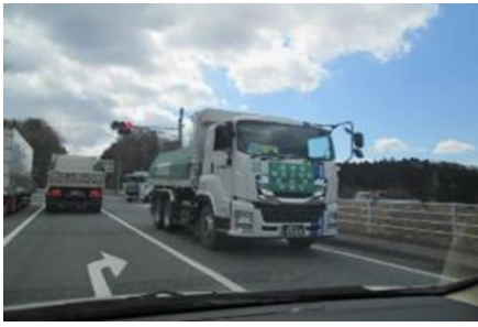
環境省管轄 除染廃棄物輸送車両