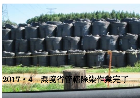
2017・4 環境省管轄除染作業完了