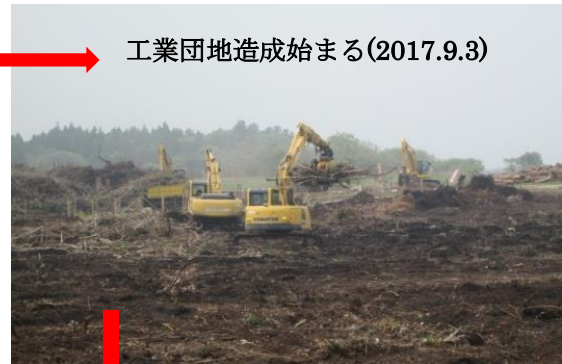
工業団地造成始まる(2017.9.3)