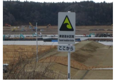
津波はここまでやって来た