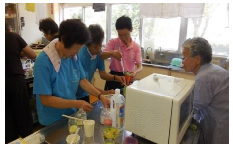
アロマキャンドル作り