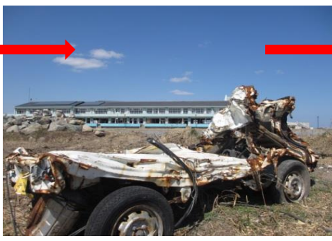
請戸小学校形のみ残る(2016.3.7)