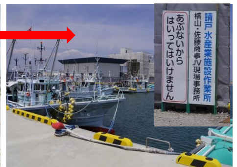
水産業施設建設中(2019.5.3) (卸売市場・水産事務所等)