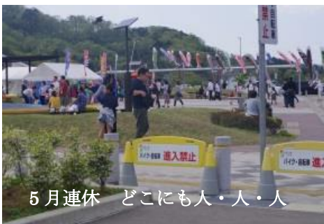
5月連休 どこにも人・人・人