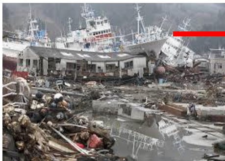
鹿島区真野川漁港壊滅(2011.4.7)