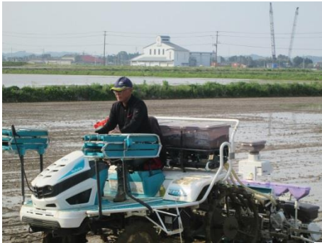
震災後初の田植えが始まった

★ 五月、田植えの時期を迎えた。整備圃場の田植えが始まった。老いても次世代へ繋ぐために力を結集する農家、酪農家、息子3人が担う建築業一家。そして若者の学び。