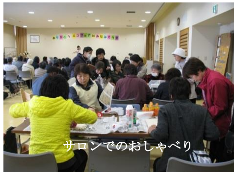
サロンでのおしゃべり

催しがあると住民はやって来る。再会と安否確認の場であり、笑いと涙の輪ができる。戻った人、避難先での生活を選択した人、どちらも故郷を想う気持ちに変わりはない。私たちのイベントは8回を重ねた。