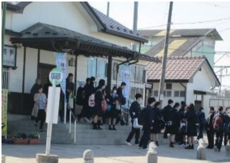
小高駅 新規開設高に向かう生徒たち

★ 南相馬市には、3つの高等学校がある。避難解除後小高区に開校した「県立小高産業技術高校」、約110年の歴史ある「県立相馬農業高校」、普通高校「県立原町高校」である。震災直後は、サテライト校での学校生活だった。ようやく、落ち着いてそれぞれの校風を生かした教育が行われている。まだ生徒数は震災前に戻らない。