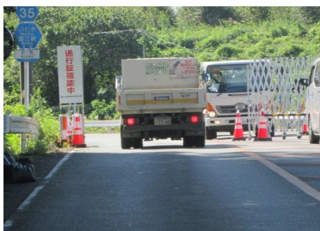
県道 35 号線この先双葉町立ち入り禁止 「帰還困難区域」に入る