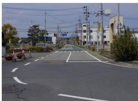
浪江駅前広場 人がいない

浪江町は平成 29 年 3 月 31 日一部避難指示解除。震災前 21,000 人いた住民のうち、戻ったのは 900 人に過ぎない。役場機能の再開、周辺地域の再開発とハード面での復興が進んでいる。しかし、かつて賑やかだった駅前通りは、未だに当時のままである。(いずれも 2019. 5. 3 撮影)