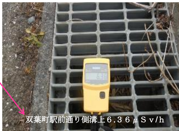
双葉町駅前通り側溝上 6.36 μSv/h

「帰還困難区域」の双葉町・大熊町は、「復興拠点地区」を設定。役場等の公共施設の建設、周辺地域復旧を目指す。