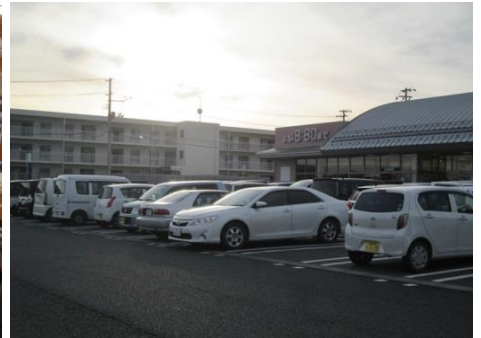
商業施設前の災害公営住宅

催しがあると住民はやって来る。再会と安否確認の場であり、笑いと涙の輪ができる。戻った人、避難先での生活を選択した人、どちらも故郷を想う気持ちに変わりはない。私たちのイベントは8回を重ねた。