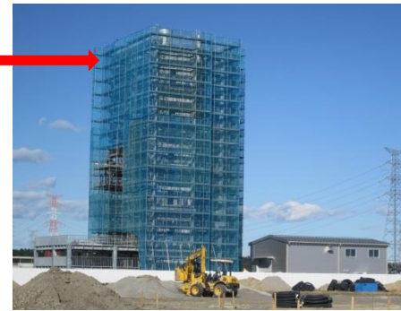
ロボットテストフィールド建設中