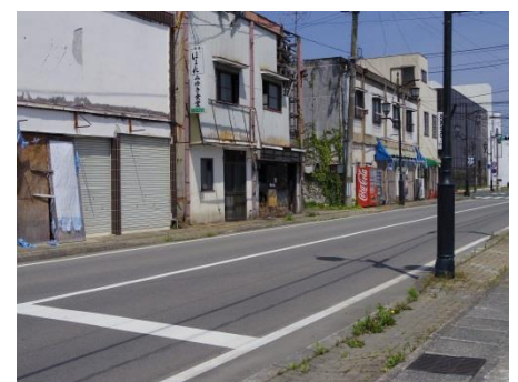
街中は当時のまま