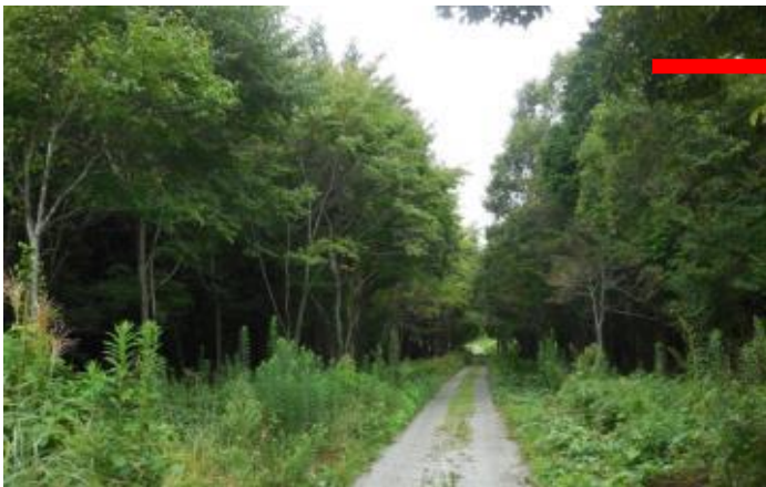
津波から免れた唯一の海岸林

南相馬市小高区浦尻地区から浪江町棚塩地区へ続く海岸林は、唯一津波から免れ、豊かな植生が残った。しかし浪江町棚塩地区海岸林は、イノベーション・コースト構想として、水素製造工場の建設が進んでいる。復興優先で浪江町の貴重な自然は消滅する。