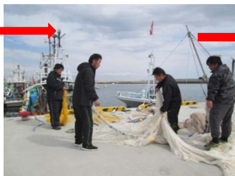
復旧漁船 28 隻係留(2017.2.20)