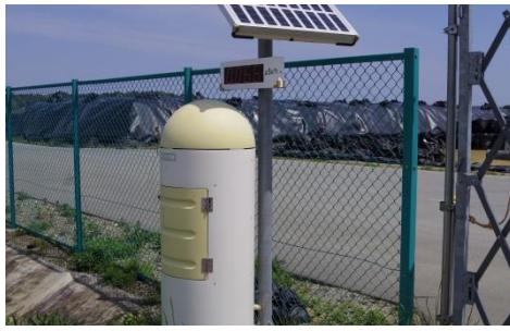
行津(なめつ)地区除染仮置き場