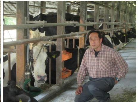
酪農4代目になる息子が戻る日は近い

★ 南相馬市には、3つの高等学校がある。避難解除後小高区に開校した「県立小高産業技術高校」、約110年の歴史ある「県立相馬農業高校」、普通高校「県立原町高校」である。震災直後は、サテライト校での学校生活だった。ようやく、落ち着いてそれぞれの校風を生かした教育が行われている。まだ生徒数は震災前に戻らない。