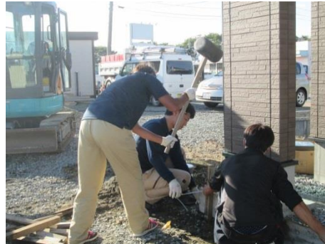
住まいは暮らしの基本