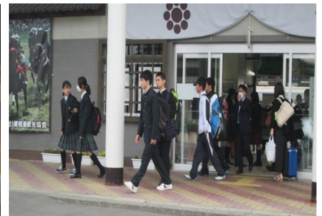
原ノ町駅 登校風景