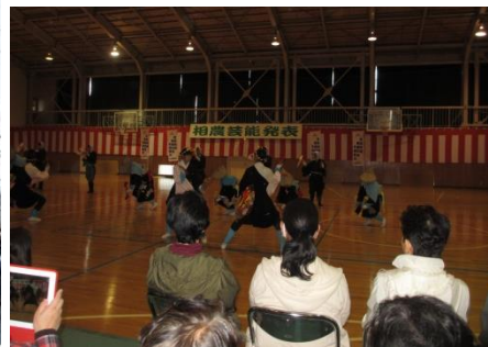
相農生による伝統芸能披露