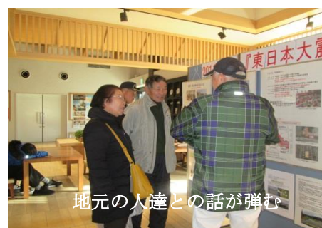
地元の人達との話が弾む