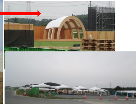
第 69 回全国植樹祭会場(2018.6.5)