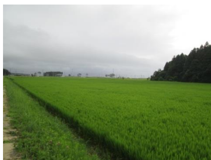
7月下旬 穂が出始めた