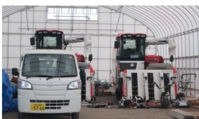
作業所内の最新農機具