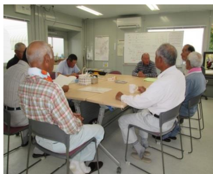
朝8時 組合員の打ち合わせ会