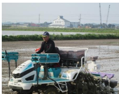
5月の田植え 機械で直播