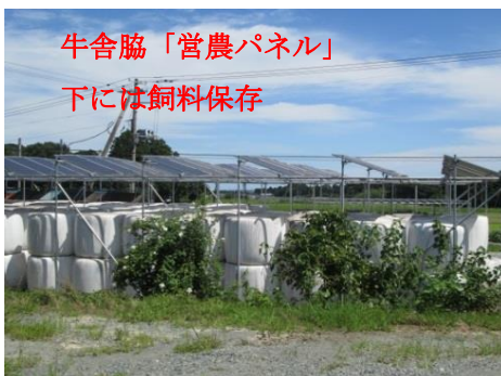
牛舎脇「営農パネル」 下には飼料保存