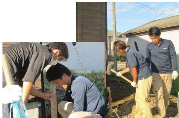
飛鳥さん若手に指導