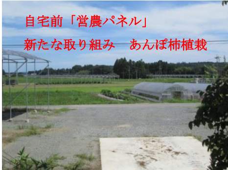
自宅前「営農パネル」 新たな取り組み あんぽ柿植栽