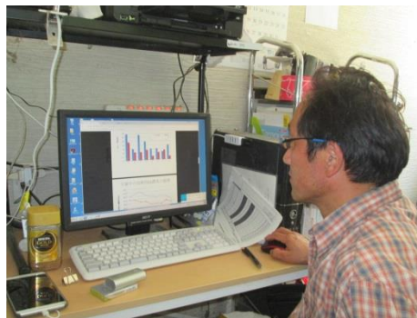
搾乳量のチェック