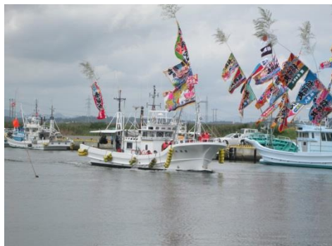
漁船は大漁旗で祭を盛り上げる