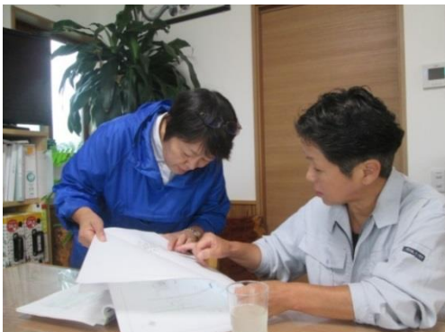
女性建築士と打ち合わせ

「小高区は、2,800人戻ったというが、戻ったのは年寄りばかり。若い家族は戻らない。解体された屋敷跡に「俺ら夫婦だけだから小さく作ってくれ」との注文が多くなった。