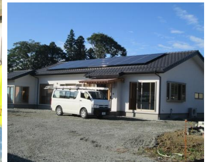
屋敷跡に小さな家