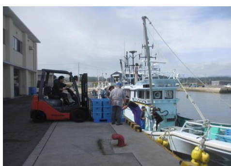
ホークリフトで運ぶ