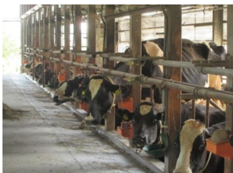
40頭のホルスタイン