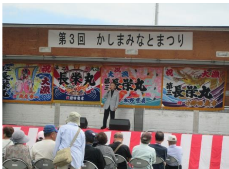
第 3 回鹿島港祭