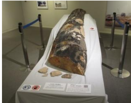
伐採された鹿島の一本松展示