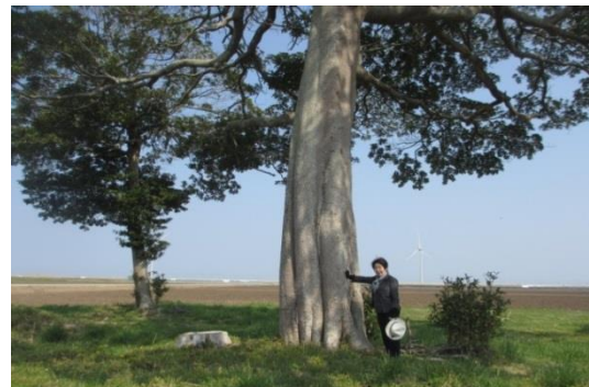
北右田桶師屋地区 津波をかぶった巨大タブノキ (表紙)