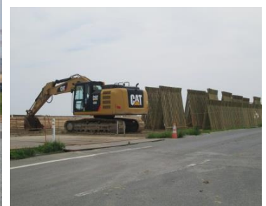
苗木の枠組み材の組立て

復興ボランティアによる照葉樹の植栽もある。混植なので成長過程において、樹木の自然淘汰が予想される。