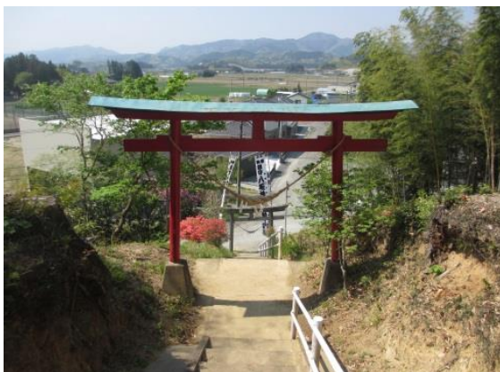
参道石段から集落を望む

神社の石段を上がると遠くに阿武隈山脈、眼下に広い平野が見渡せる。「樹木天然記念物」のアカガシのほか、多様な植生があり、豊かで貴重な自然林として知られる。