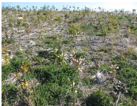
鹿島区右田浜 防潮堤照葉樹の植栽 1 年目

復興ボランティアによる照葉樹の植栽もある。混植なので成長過程において、樹木の自然淘汰が予想される。