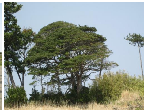
津波をかぶったタブノキ