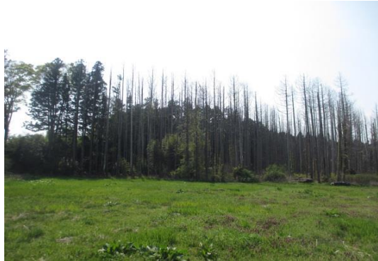
津波で枯死 上洪佐屋敷地区 杉林と樺