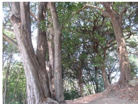
アカガシ樹林の巨木