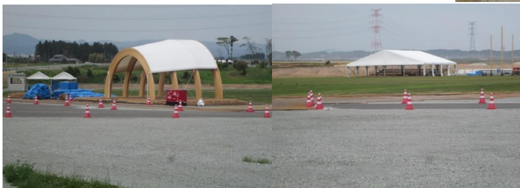
「植樹祭」 天皇・皇后両陛下お立ち台 準備が進む開催地