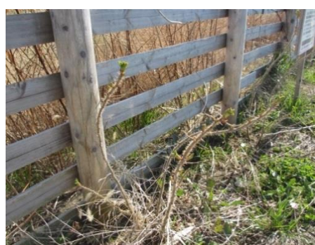
県立相馬農業高校農業クラブによるハマナス植栽地 1 年目