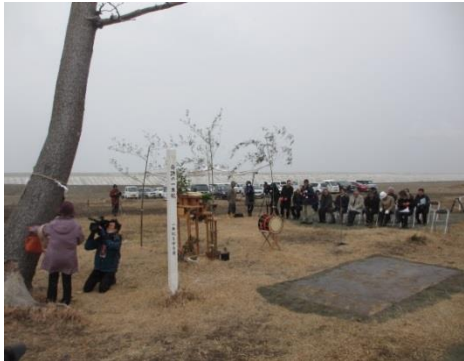
かしまの一本松 お別れ会

平成 29 年 12 月 23 日お別れ会が開かれ、切り倒された。この地は、防潮林造成のため嵩上げされ一本松の 2 世が植栽される。