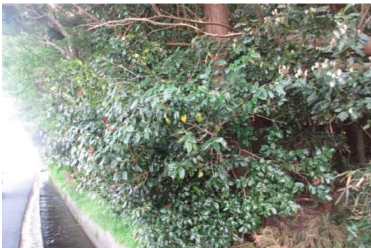
上洪佐原畑 津波を免れた椿群生地

高さ 15m を越える津波は、防潮林をなぎ倒し集落を呑み込んだ。奇跡的に津波から免れた屋敷林と樹木林があった。沿岸に関わらず微妙な地形により津波が拡散されたためである。タブノキなどが残った。