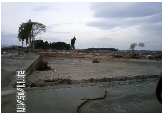
原町区南萱浜地区 残ったのは屋敷林のみ

震災の津波で消失した多くの屋敷林(いぐね)がある。最近の生活様式の変化により、屋敷林の役割が減ってきている。山沿いに残るものも原発事故で木々が放射能物質に汚染され伐採、消滅した屋敷林も多い。