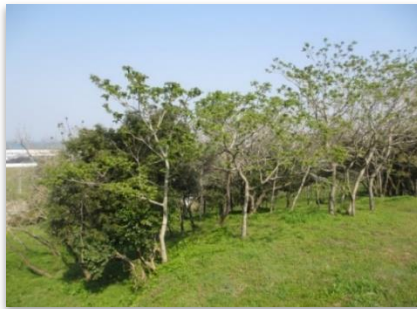
東側の椿とクルミ林から太平洋を望む