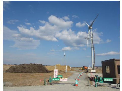
盛土は嵩上げの高さ 一本松と風力発電機