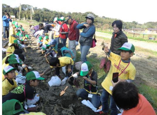
芋ほり体験（あとで焼き芋にして食べました）